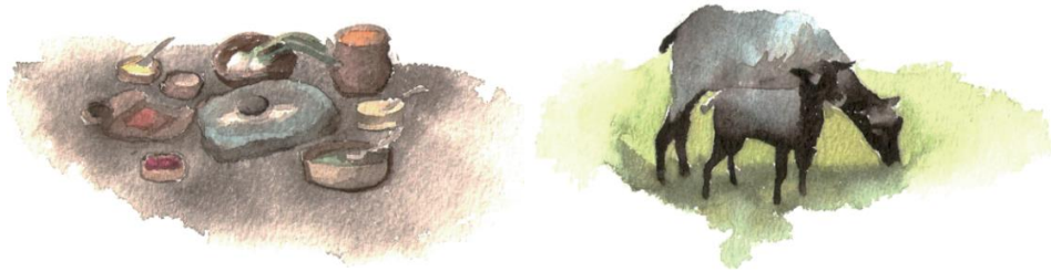
Mat och får, som det kan ha sett ut under järnåldern. Illustration: Anna Fransisca Nilsson

Vid järnåldern var boskapsskötsel vanligt, hur människorna åt samt levde under den tiden. Människorna använde näringen som de själva producerade såsom ost, smör och syrad mjölk som de fick från får och getter samt protein från grisarna och fisket. Hästarna var heliga djur under denna tid och människorna åt då hästkött vid högtider. De åt även ärtor och bönor för att få i sig tillräckligt med protein. Människorna odlade mycket växter såsom kål och rovor. Vissa av växterna användes även som kryddor under matlagning.