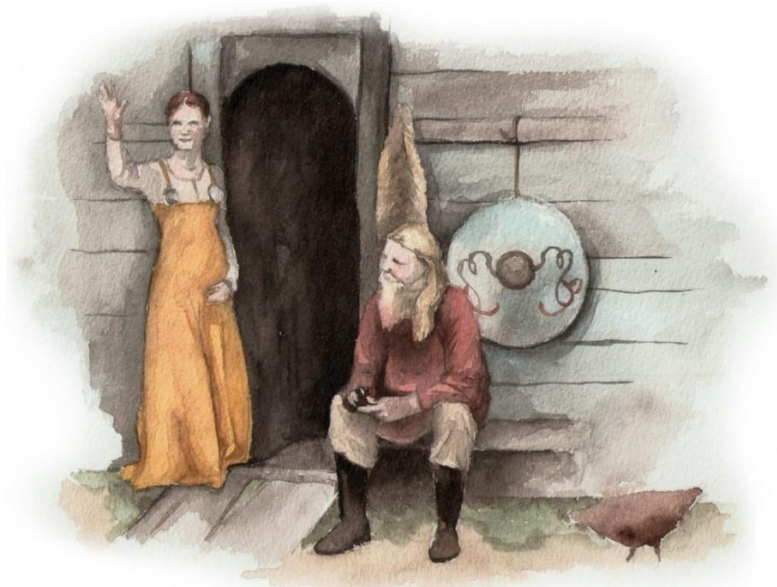
En kvinna och en man under järnåldern. Illustration: Anna Fransisca Nilsson

Klimatet blev sämre under järnåldern. Det blev kyligt och regnigt. Husen var tvungna att göras varmare med eldstad och varma kläder med ull från fåren. Kläderna var framför allt tillverkade av ull, men även av hampa, lin, siden och skinn.