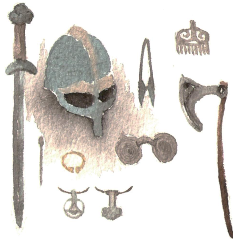
Redskap och vapen under järnåldern. Illustration: Anna Fransisca Nilsson

De nya redskapen av järn gjorde det lättare att t.ex. jaga, laga mat och bygga hus. Det sägs att skett en teknikrevolution i samhället under järnåldern.