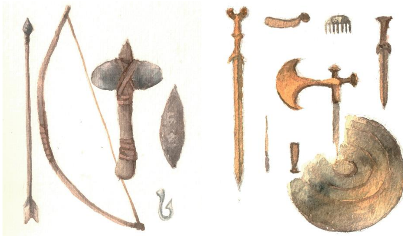
Vapen och föremål som man kan hitta i gravar från stenålder och bronsålder. Illustration: Anna Fransisca Nilsson

Under forntiden, mer specifikt brons - och järnålder användes olika stensättningar vid begravning av den avlidne människan. Stensättningar byggdes traditionellt på platsen där den avlidne människan kremerats, på kvarliggande askan eller benrester. Själva stensättningarna bestod utav sten och kunde variera i form, exempelvis cirkulär, oval och rektangulär form. Det var först under mitten av bronsålder som det blev vanligt med kremering av de avlidna, där en ny stensättning gjordes för varje människa som avled. På platser där det finns flera stensättningar kallas oftast ett gravfält. I dagens läge är det ofta svårt att hitta och se dessa gravplatser eftersom de ligger gömda av torv eller högt gräs. Hittar man däremot en gammal boplats kan man även leta efter stensättningar då de ofta placerats i närheten av själva boplatsen.