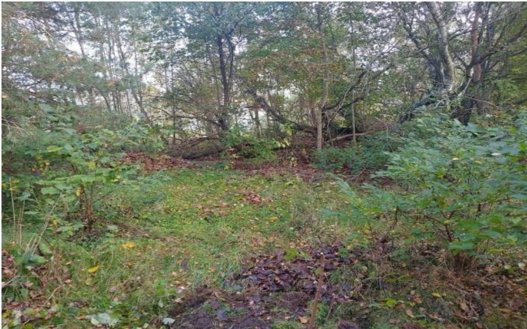
Bilder från stensättningen intill Våxtorpskolans idrottsbhall. Området är idag till stor del överväxt.