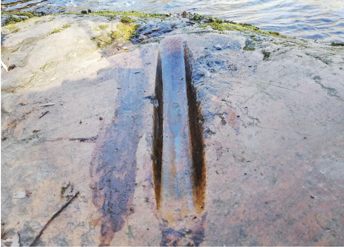
Sliprännan i Knäred.

Flertal forskare har gjort antagandet att redskapen som slipats har varit stenåldersverktyg, såsom yxor och mejslar. Således kan inte heller forskare förbise att en del av rännorna kan vara yngre än vad de tror. Vidare hävdar en del forskare att en förändring skedde under järnåldern angående sliprännorna syfte och då de tror att de började förknippas med religion eller dyrkan av någon form. Det skrivs även att detta fortsatte under järnåldern och även eventuellt in på medeltiden. Därav förklarar forskarna att sliprännorna fortfarande är ett olöst mysterium då ingen kan fastställa deras uppkomst och ändamål.