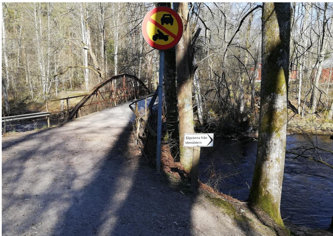
Bron över Krokån. Skylt till sliprännan.

För bättre sikt kan ni gå över bron för att kunna se sliprännan från andra sidan. Sträckan är strax över en kilometer och tar cirka 15 minuter att gå. Platsen där sliprännan ligger är i vid botten av en brant backe vid en å, vilket innebär att försiktighetsåtgärder bör tas, exempel på detta är att en vuxen står närmast sliprännan. Eleverna kan även komma fram gruppvis för att förhindra trängsel och olyckor. Området runt omkring sliprännan är ett naturreservat med fin miljö för utomhuspedagogiska moment. Informera eleverna om vad som gäller vid besök på ett naturreservat.