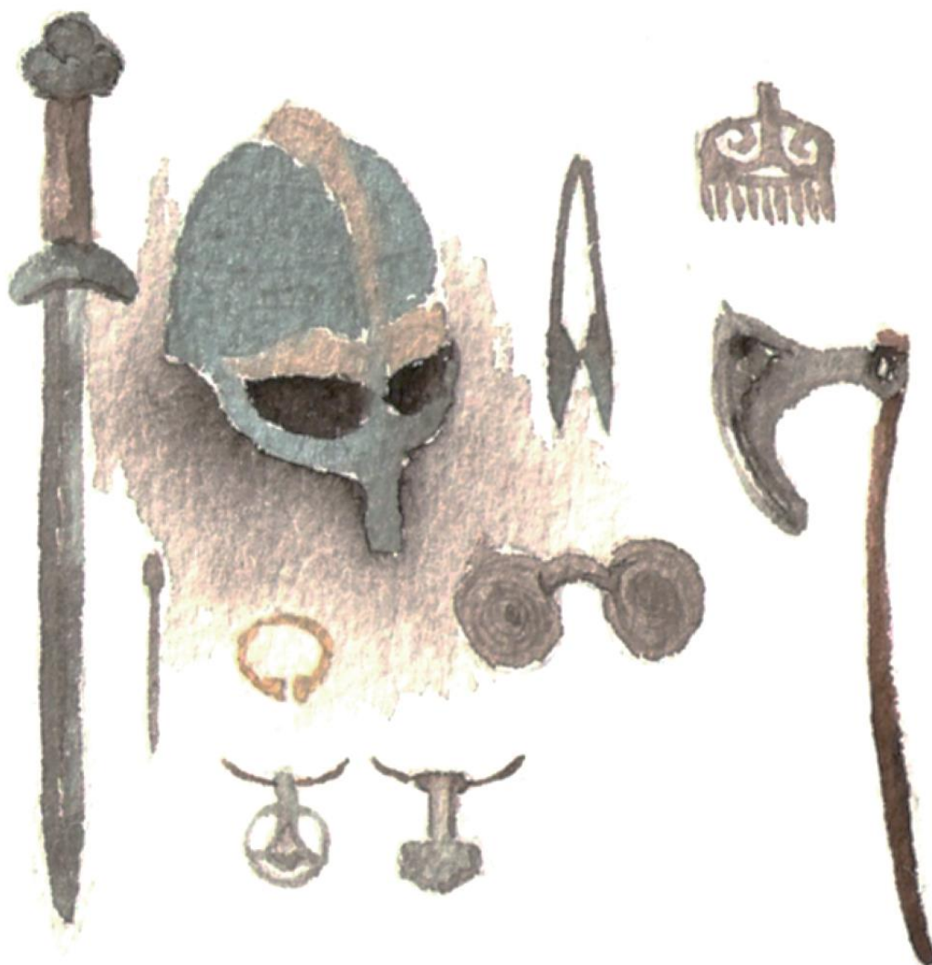
Teckning av hur föremål, svärd, smycken kunde se ut under järnåldern. Illustration: Anna Francisca Nilsson