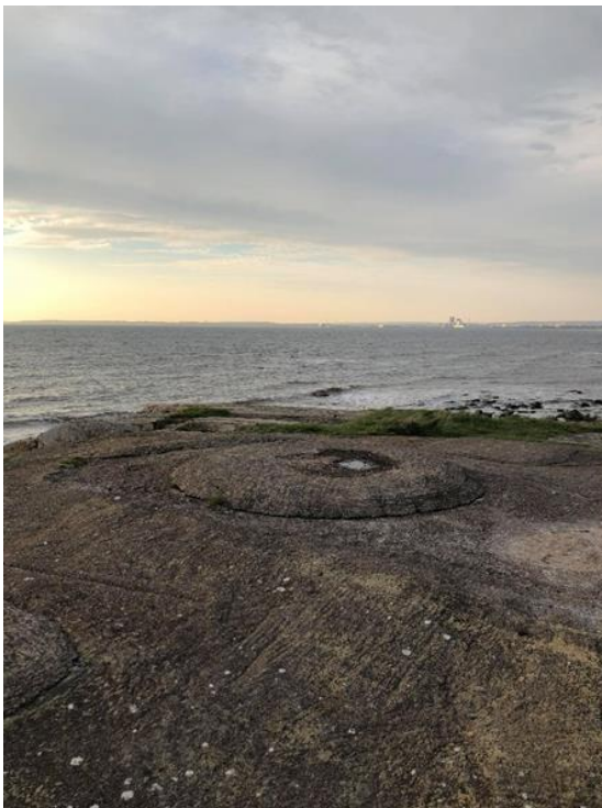
Päärps klapperstensgravfält.

Det finns andra närliggande ytor där man har hittat fynd, vilket påvisar boaktivitet.