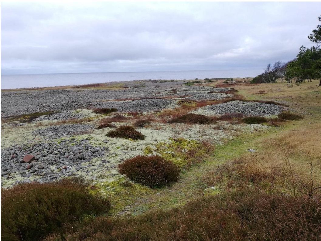
Pårps klapperstensgravfält.