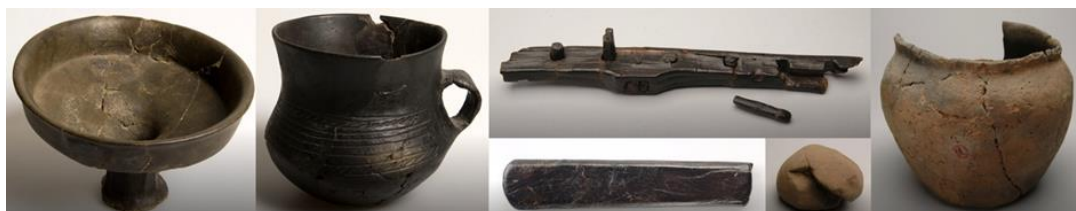
Fynd från Käringsjön: keramikföremål, räfsa, knivskaft i trä samt en sten av bergart. Föremåls-ID: 23159

Till fots: 4,1 km. Ta gångstigen in till orten Åled, sedan vänster in på Halmstadsvägen. Efter ca 2 km svänger man in på en skogsväg och kommer då fram till Käringsjön från motsatt håll.