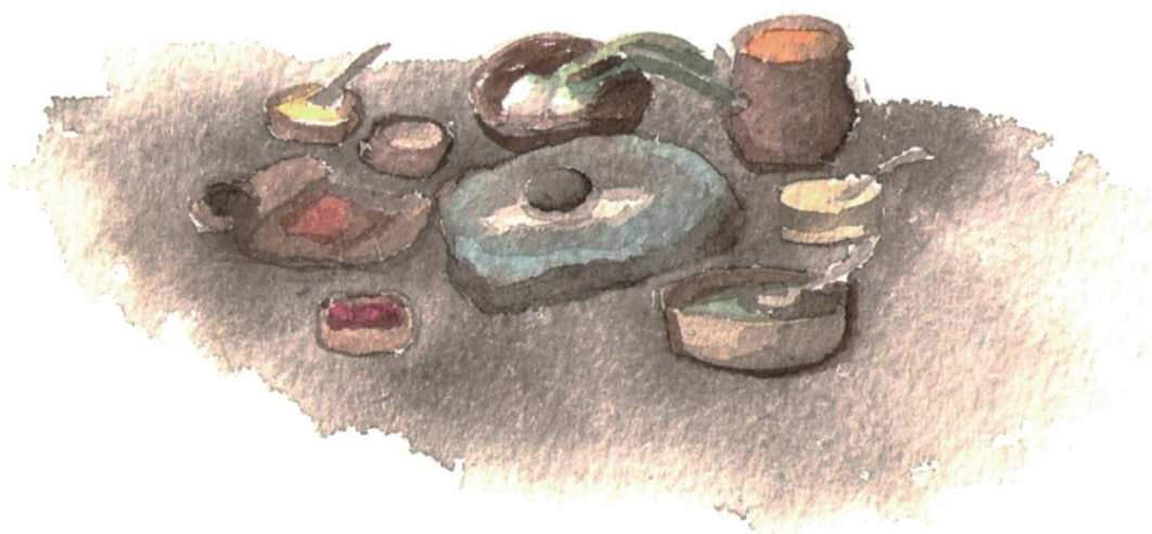
Exempel på mat under järnåldern. Illustration: Anna Fransisca Nilsson

Vid utgrävningarna av Käringsjön har man gjort fredliga fynd i form av bearbetat trä och keramik, främst brukskeramik men även en del av finare kvalitet. Matkäril offrades ofta som del i en fruktbarhetskult, för att försäkra sig om gudarnas välvilja och framgång i jordbruket. Lämningar av trä, såsom tjuderpinnar och räfsor, har klarat sig bra i den syrefattiga mossen och är av högt historiskt värde då vardagsredskap av trä från svensk järnålder är sällsynta.