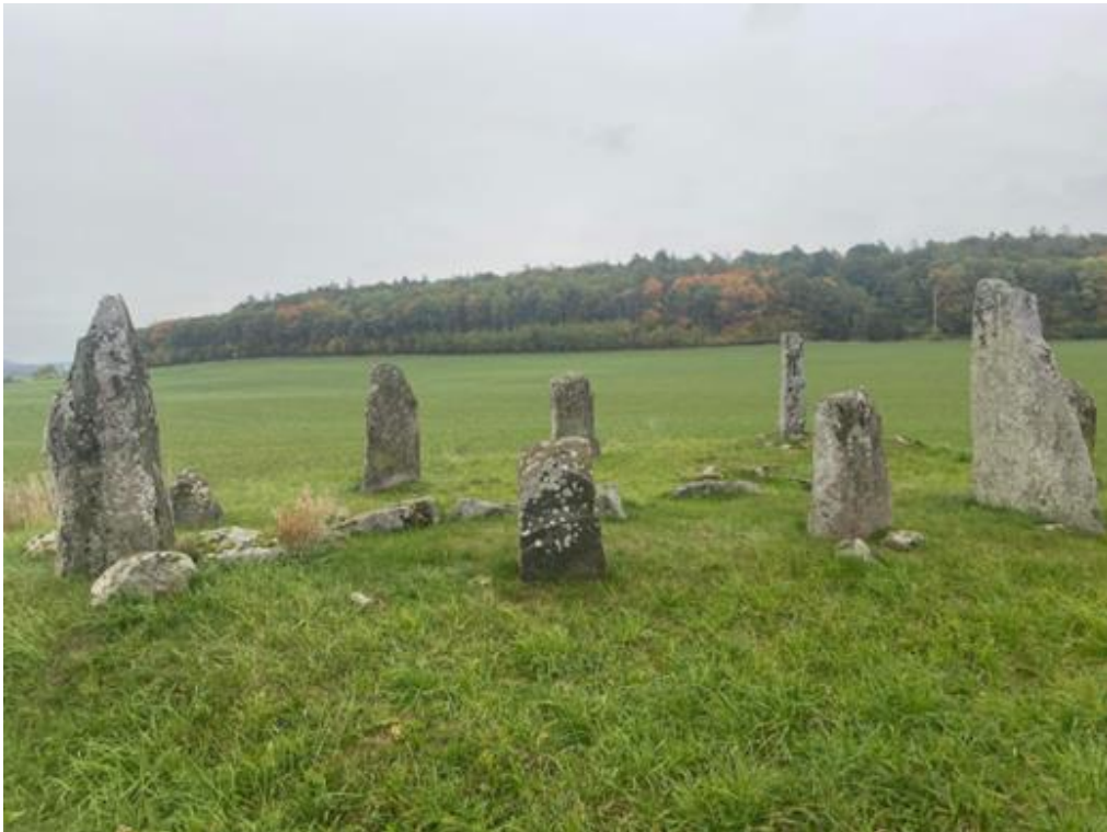
Klockstenarna. Foto: Joakim Ivarsson, 221005

Klockstenarna som befinner sig utanför Falkenberg, Slöinge är en skeppssättning bestående av 10 resta stenar (Riksantikvarieämbetet, 2018). Vissa av stenarna är resta i sen tid, år 1926. Skeppssättningar var vanligt under bronsåldern och järnålder. Namnet har samband med en inskription på en klocka i Eftra kyrka (Skylt av Länsstyrelsen i Halland, 2004).