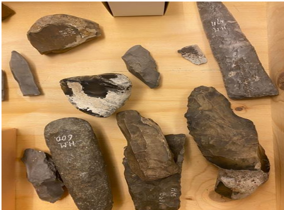
Flintyxor. Stiftelsen Hallands läns museers magasin, Slottsmöllan.