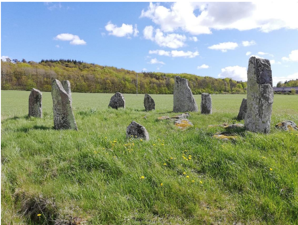
Klockstenarna, foto: Johanna Petersson