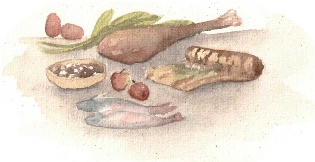
Stenåldersmat. Illustration: Anna Fransisca Nilsson