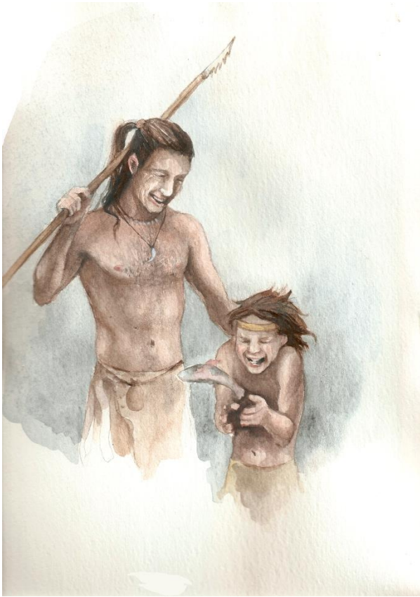
Stenåldersmänniskor. Illustration: Anna Fransisca Nilsson