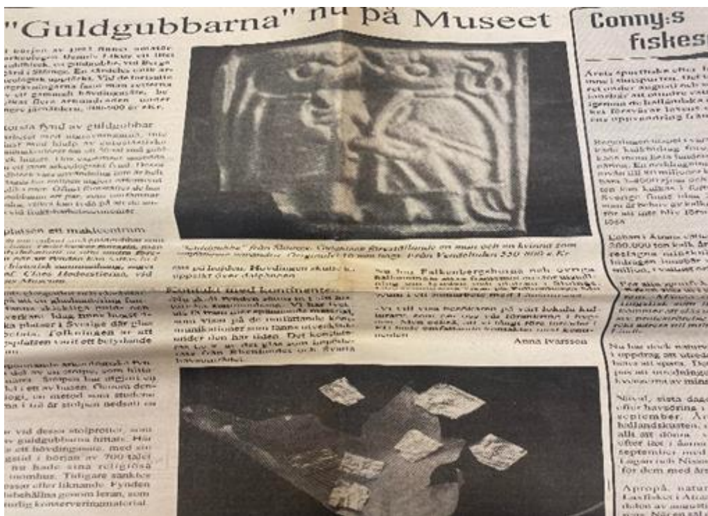
Tidningsurklipp. Stiftelsen Hallands läns museers magasin, Slottsmöllan.