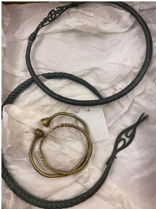
Bronsföremål. Stiftelsen Hallands läns museers magasin, Slottsmöllan.