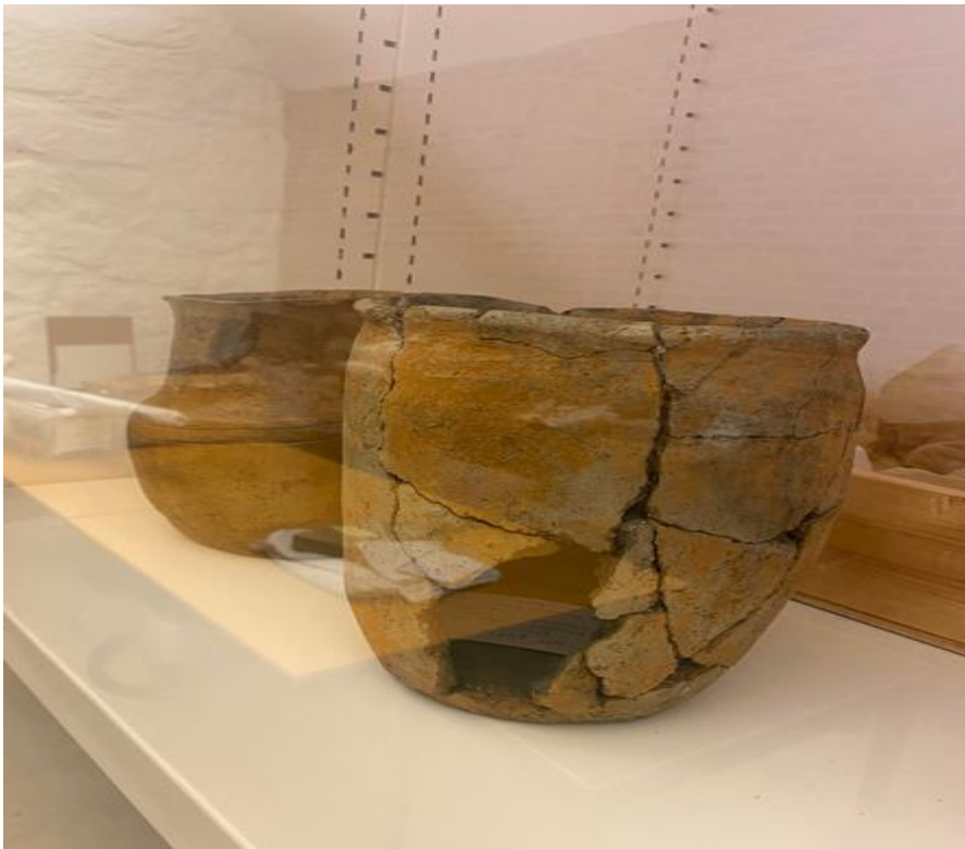
Gravurnor. Stiftelsen Hallands läns museers magasin, Slottsmöllan.