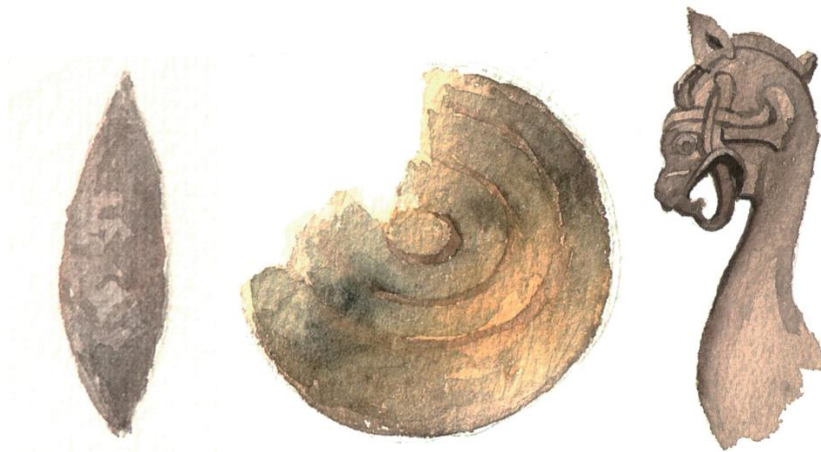
Flintasten, bronsköld, drakhuvud. Illustration: Anna Fransisca Nilsson